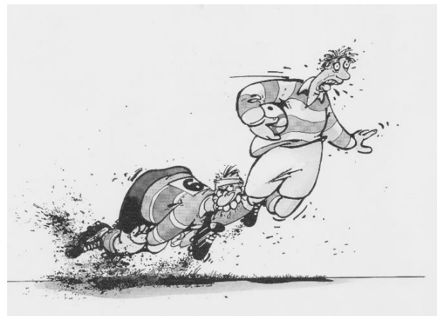
Het 'enkelbijtertje' door Blachon

Het boek is op dit moment niet meer te koop, maar wil jij jezelf vereeuwigen in een tekening? Stuur Maarten dan vooral even een berichtje op Instagram: Maarten.Tekent. Kap'tein Aardbei